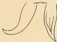
Penis von A. mutilatus .